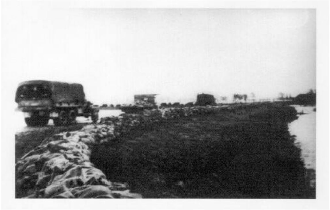
Kolonne militaire voertuigen op de Schenkeldijk tijdens de hulpacties na de watersnoodramp, 1953